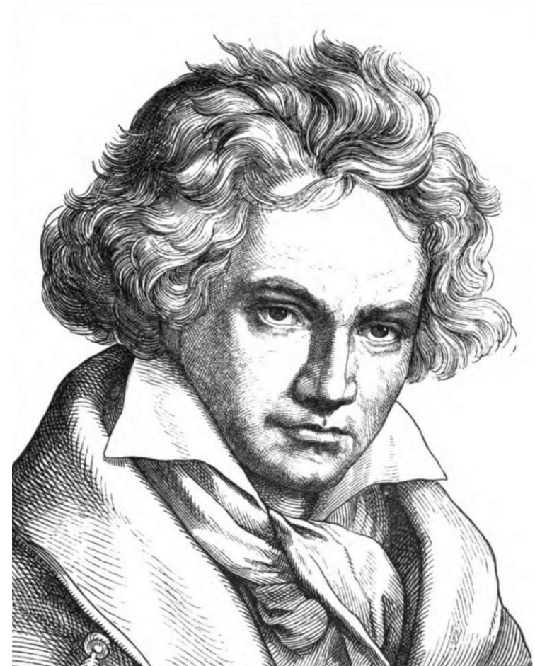
Ludwig van Beethoven